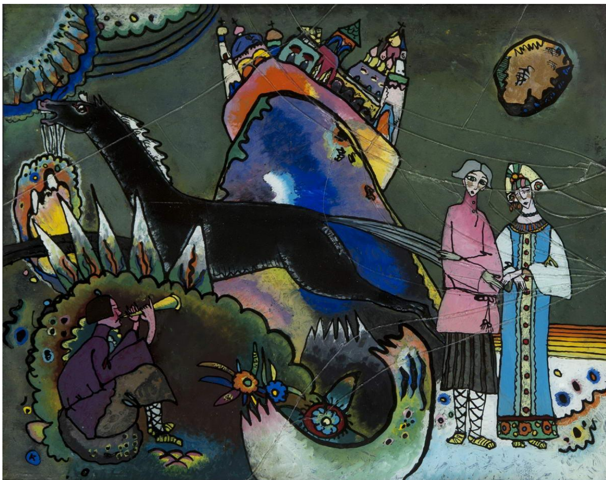
1) Василий Васильевич Кандинский. Золотое облако, 1918. Стекло, масло, 24х31. Государственный Русский музей